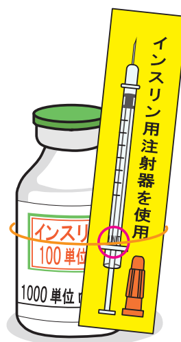
図3 インスリン専用注射器使用の注意喚起例

インスリン専用注射器を必ず使用する環境の工夫も必要である。これまでも「インスリン注射器を使用すること」と明記したカードをインスリンバイアル製剤に輪ゴムでくくるなどの例が提示されている 8) 。医療従事者の準備動線や物品配置などを考慮し、専用注射器を必ず手にとるよう、注意喚起表示が目に入る表示を医療機関ごとに工夫するとよい（図3参照）。